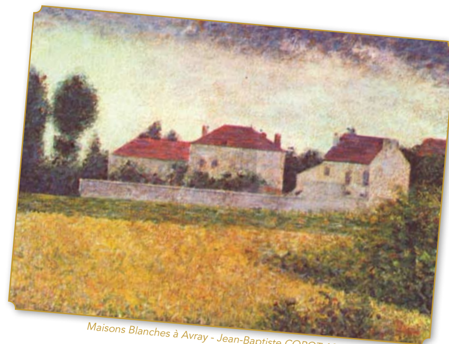
Maisons Blanches à Avray - Jean-Baptiste COROT 1880